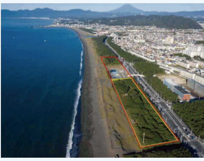
平塚市と積水ハウス等が伐採しようとしている樹林帯(黄色の線/赤線は計画区域全体)