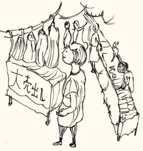
子どものころは「まちに行く」のがとても楽しかった。

平塚の子は、平塚駅や駅近くの商店街へ行くことを指して、「まちに行く」と言います。平塚駅前商店街はとても賑やかでした。その賑やかさが、いかにも「まち」っぽくて、子どもながらに誇りしかなかったのを覚えています。その中でも別格だったのが、デパートの「梅屋」でした。この梅屋さんが閉店になりました。それがマンションになろうとしています。とてもショックでした。