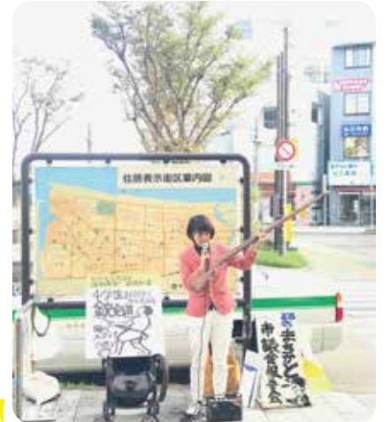
平塚駅前毎週末「まちかど市議会報告会」やっています